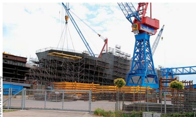
Mitte Juli erfolgt der Stapellauf von „E-Ship 1“ in Friedrichsort.

Bei der Lindenau Werft trägt der Neubau die Baunummer 285. Auf der Werft ist das Schiff aber inzwischen unter seinem Projektnamen „E-Ship 1“ bekannt. Das 130 Meter lange und 22 Meter breite Schiff ist als RoRo-Frachter für den Trans-